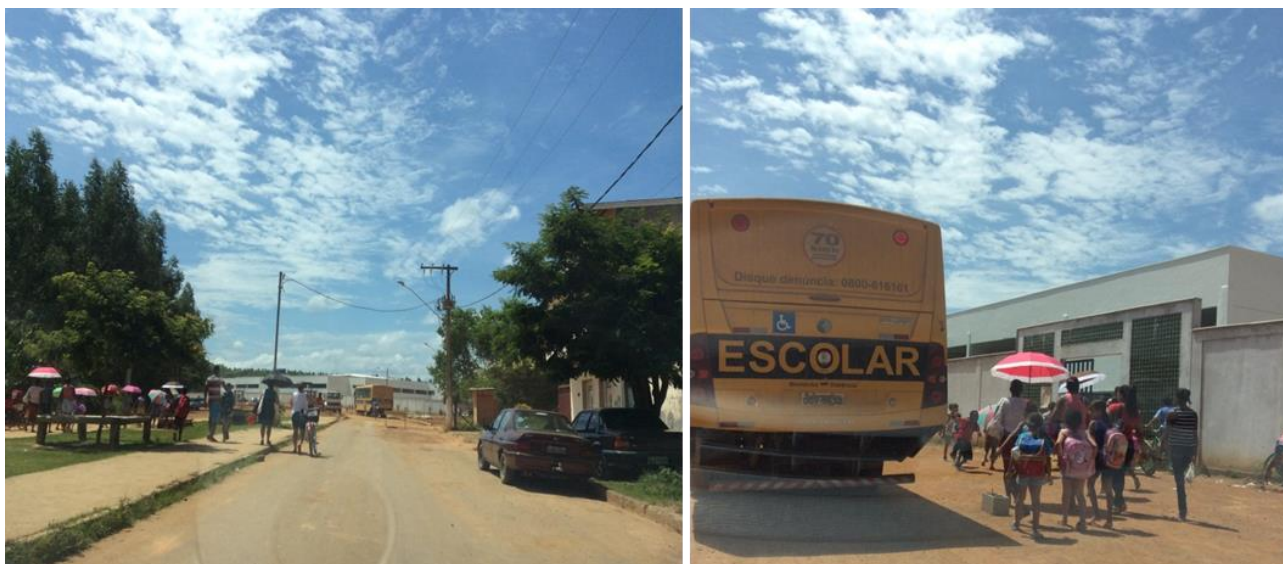
Ilustração 1: Chegança. À esquerda crianças e familiares a caminho da escola, na Av. Juscelino Kubitschek, Distrito de Cachoeira Escura, Belo Oriente/MG. À direita, a entrada da Escola Municipal Hilda Morais. 16 de março de 2018.

Em Belo Oriente, o prédio da Escola Municipal Hilda Morais é uma construção nova, ao final de uma grande avenida. Não há casas ao lado, apenas estrada e uma área de plantação de eucalipto (matéria-prima para a fábrica de celulose da região). De acordo com informações disponibilizadas pela secretária da escola, no ano de 2018, período em que a prática de pesquisa foi realizada, havia 482 crianças matriculadas no Ensino Fundamental - anos iniciais (1º ao 5º ano), no turno vespertino.