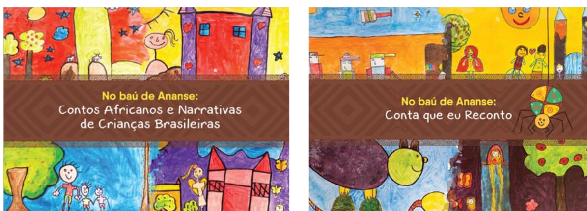
Ilustração 3: No Baú de Ananse. Capas dos livros digitais, com inclusão de painéis pintados pelas crianças que participaram da Oficina de Histórias. Criação de Hudson Sales.

Após o Movimento Revisão das Histórias, as histórias narradas pelas cinquenta e seis crianças que participaram da oficina foram publicadas em dois livros digitais.