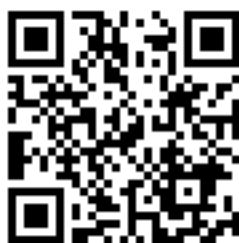
Figura 6 – Código QR: Espetáculo Cacos para um vitral – Agosto de 2014 6

pelo viés da teatralidade e da performatividade se caracterizam pela manutenção da ação cênica como foco e com pouquíssimos recursos de narrativa.