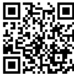
Figura 1 – Código QR: Esquete ‘Na ponta do Pé’ < https://www.youtube.com/watch?v=vN2doltLxXw >