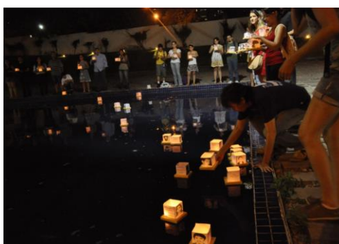
Figura 8 – Intervenção Urbana com familiares de mortos e desaparecidos políticos (2013)