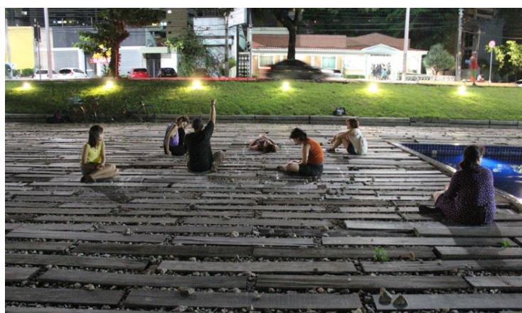
Figura 10 – Performance realizada sobre os dormentes (2016)

Em 2016, realizamos uma performance no âmbito do projeto Conexões Cartográficas da Memória (Figura 10). A ação inspirou-se numa anedota contada pelo arquiteto Robledo Valente: ao ser questionado se os dormentes de madeira ao redor do edifício atrapalhavam os visitantes, o arquiteto Sérgio Bernardes teria dito que, ao olhar para o chão para não tropeçar, o transeunte baixaria a cabeça em reverência simbólica ao Castelo Branco. Essa informação motivou nossa performance de desobediência ao "pedido arquitetônico": sentamo-nos nos dormentes de madeira e neles escrevemos, com giz de cera, nomes e frases alusivos aos mortos e desaparecidos políticos.