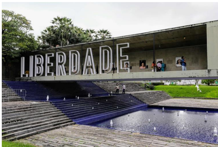
Figura 15 – Galeria da Liberdade em sua nova disposição