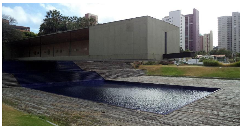
Figura 2 – Mausoléu Castelo Branco antes da mudança