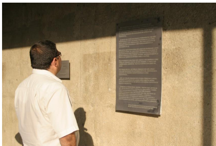
Figura 5 – Placas com discursos ufanistas do Castelo Branco (2011)

Dois anos depois do surgimento do CAP, fomos convidados pelo artista e curador Júlio Lira, do projeto Percursos Urbanos, a mediar uma visita ao ex-Mausoléu. Foi quando passamos a criticar publicamente a manutenção daquele monumento à barbárie. O local era acessível a qualquer transeunte, sem necessidade de autorização, e exibia placas metálicas com trechos de discursos de Castelo Branco (Figura 5). Também era possível adentrar o prédio e aproximar-se dos túmulos que abrigavam seus restos mortais e os de sua esposa, Argentina Vianna (Figura 3).