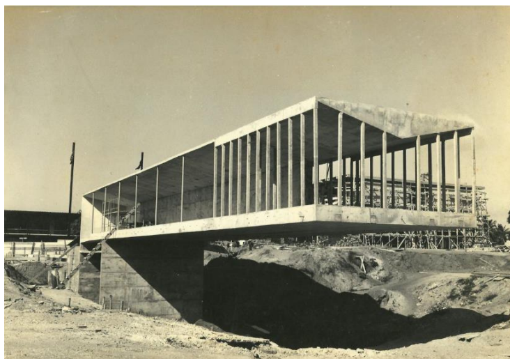
Figura 1 – Construção do Mausoléu Castelo Branco (1972)

(UFC) destacou o caráter alegórico das carnaúbas enfileiradas, dispostas como em continência ao general homenageado.