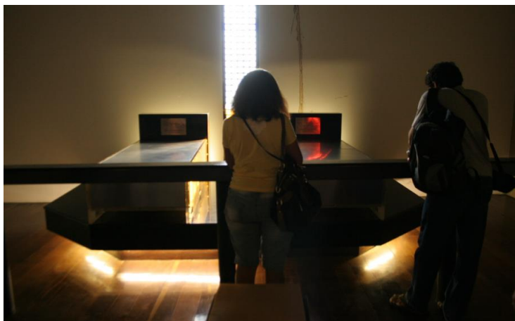
Figura 3 – Os túmulos do Castelo Branco e sua esposa (2011).