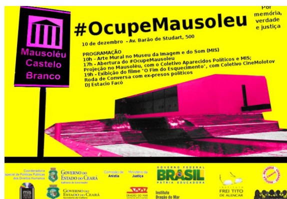
Figura 9 – Divulgação do #OcupeMausoleu (2015)