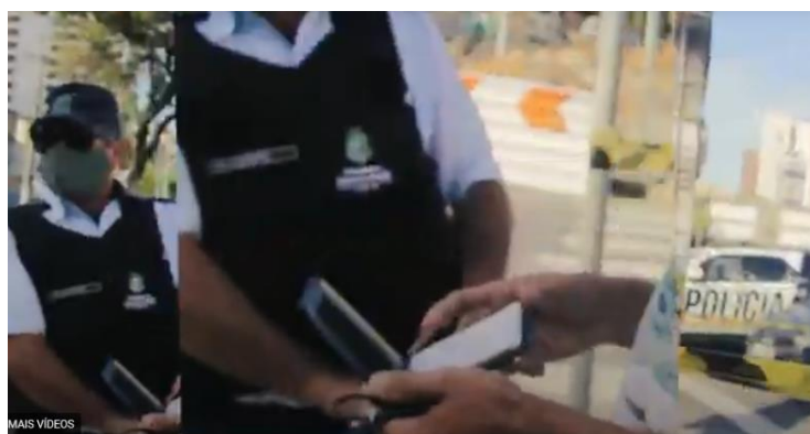
Figura 11 – Abordados pela Polícia Militar (2021)

Em 2021, lançamos uma campanha de financiamento colaborativo para nosso livro-catálogo, em comemoração aos dez anos do CAP. Para o vídeo de divulgação, escolhemos o Mausoléu Castelo Branco como pano de fundo (Figura 11). Por se tratar de uma área de segurança, com um perímetro de exceção, era necessária autorização para filmar o prédio. No início da gravação, fomos interceptados por uma viatura da Polícia Militar. Após longa negociação, conseguimos realizar o registro, mas apenas a uma distância considerável do monumento. Esse episódio, assim como outros anteriores de cerceamento – seja do uso do espaço, seja do registro fotográfico –, nos levou a refletir sobre a permanência daqueles resquícios ditatoriais. Por que seria preciso autorização para filmar um prédio público mesmo de longe? Apesar do obstáculo, o vídeo foi finalizado e a campanha atingiu sua meta, assegurando a publicação do livro.