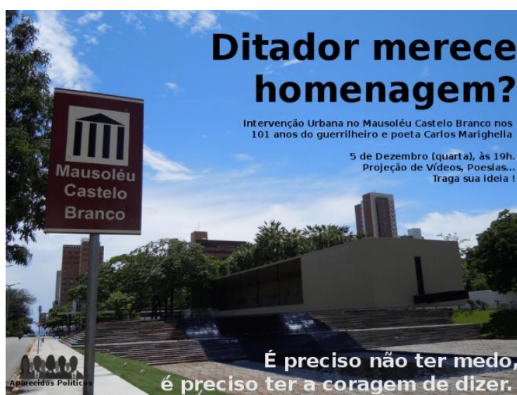
Figura 6 – Divulgação da "Operação Marighella" (2012)

Em 5 de dezembro de 2012, aniversário de Carlos Marighella, convocamos a primeira intervenção artística do CAP no monumento, denominada "Operação Marighella". Sob o questionamento "Ditador merece homenagem?" (Figura 6), projetamos vídeos sobre a memória de desaparecidos políticos. A ação, inicialmente aberta a várias organizações, teve seu alcance ampliado por uma publicação no Facebook (mais de 600 compartilhamentos), o que nos levou a sermos chamados para uma reunião de "mediação de conflitos" com o comando da Polícia Militar, contrário à realização da intervenção artística. A reunião esvaziou o ato. A proposta original de projetar diretamente na fachada foi barrada; a segurança permitiu apenas o uso de um telão à parte, cedido pelo governo. Como desdobramento, despertamos a hostilidade de setores militares locais e nacionais, sendo citados de forma pejorativa no extinto site "Verdade Sufocada", do torturador Brilhante Ustra.