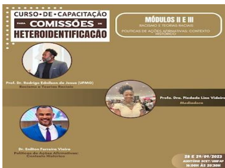
Figura 04 - Módulo 2 e 3 do curso de capacitação para comissões de heteroidentificação