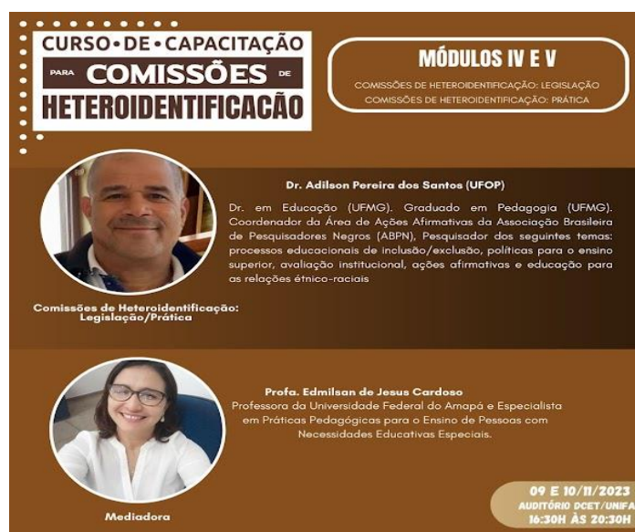
Figura 5- do curso de para comissões de heteroidentificação