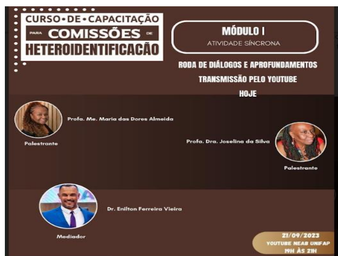
Figura 01- Módulo 1 do curso de capacitação para comissões de heteroidentificação