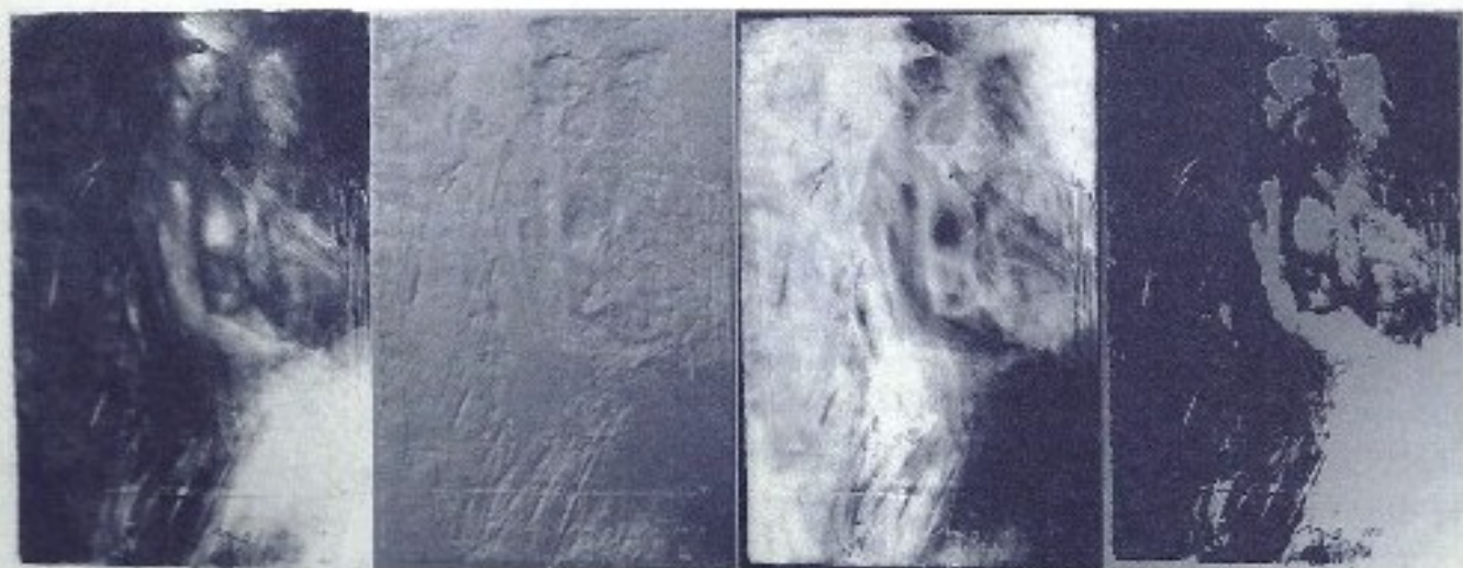
DUPLO DO TERCEIRO PERCURSO/ O OLHO BRINCANTE

A série de duplos seguintes diz respeito ao olho brincante. O conjunto é composto da reprodução digitalizada da obra focalizada seqüenciada pelos seguintes duplos elaborados com filtros no photoshop: duplo1: baixo relevo; duplo2: inversão; duplo3: gesso.