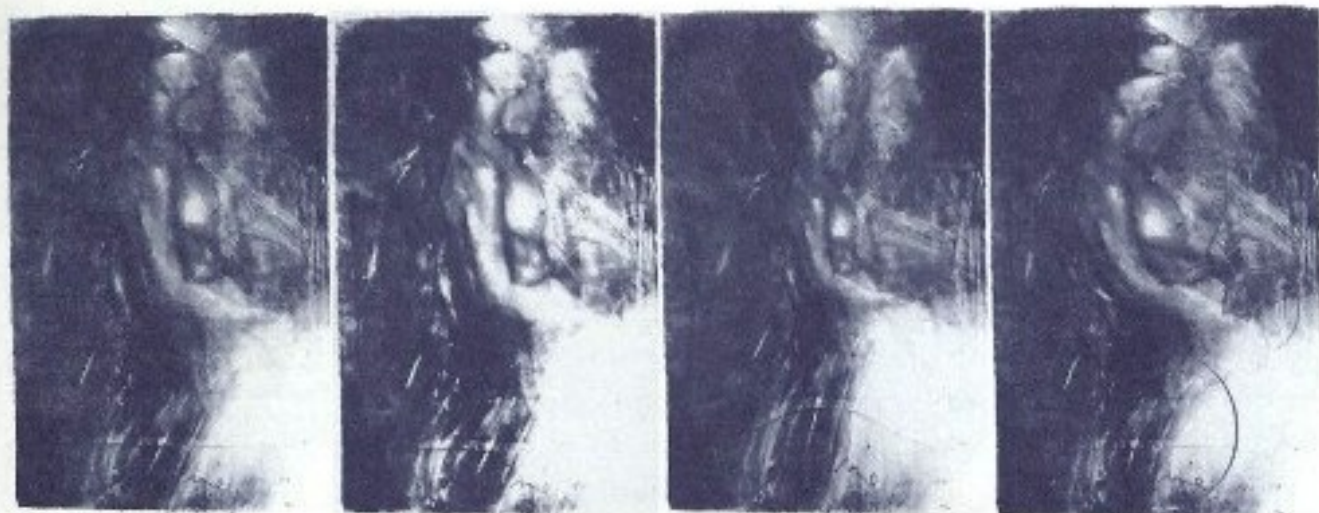
DUPLO DO PRIMEIRO PERCURSO/ O OLHO DESTERRADO