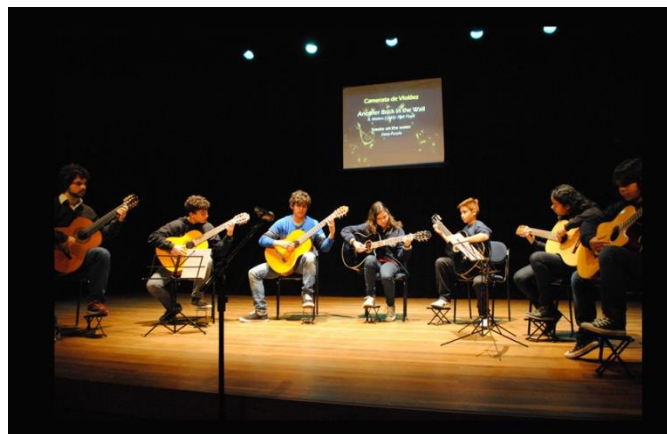
Figura 2. Camerata de Violões - Apresentação em sarau - 2015

No ano de 2016 o número de integrantes diminuiu, porém o grupo passou ser composto predominantemente por alunos de nível mais avançado o que permitiu a realização de arranjos mais desafiadores. O repertório foi composto por arranjos de rock, música clássica e temas folclóricos, além da retomada de peças dos anos anteriores. Desde o início do ano o grupo já se apresentou em recitais de entrega de avaliação, escolas da região e feiras de comércio, descentralizando o trabalho desenvolvido na FUNDARTE.