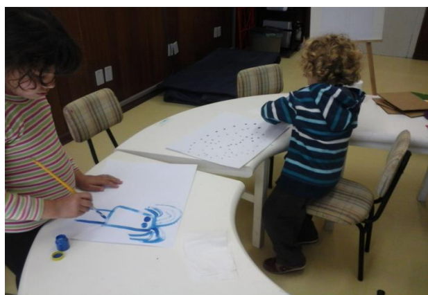
Imagem 4