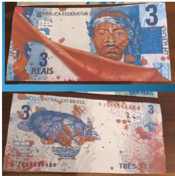
Figura 3: “Nota Desastre Mariana. O esquecimento e a injustiça com os mortos e desabrigados do desastre de Mariana(…)”

do desmoronamento de Mariana (MG), a qual não foi localizada.