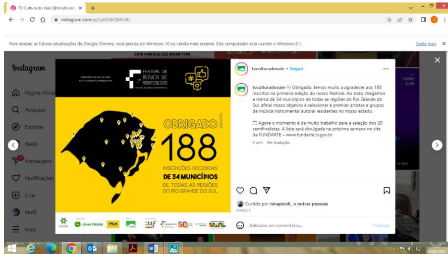
Municípios do RS envolvidos